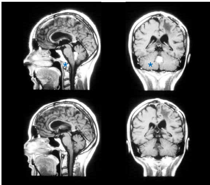
* Malignes Oligodendrogliom im 4. Ventrikel vor (oben) und nach Chemotherapie (unten). Der Tumor ist fast völlig verschwunden.

reagiert, ist bei diesen kleinen Kindern nach der Operation des Medulloblastoms eine Chemotherapie als ausschließliche weitere Maßnahme heute in Deutschland Standard.