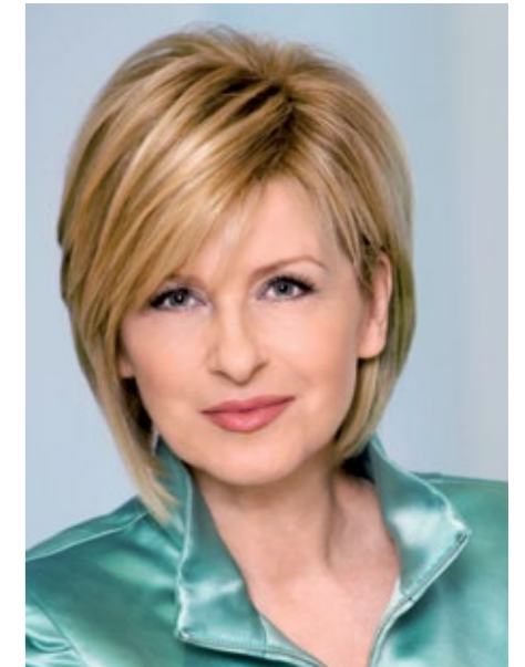
Carmen Nebel, ZDF-Moderatorin und Botschafterin der Deutschen Krebshilfe