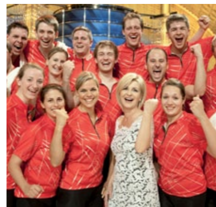
Engagierten sich für krebserkrankte Menschen: Carmen Nebel und Mitglieder der European Business School, Reutlingen.

wie Alain Delon, David Garrett, Vicky Leandros, Ben Becker, Anna Maria Kaufmann, Karel Gott, Semino Rossi, Mary Roos, Mark Medlock, Gilbert und Volker Lechtenbrink.