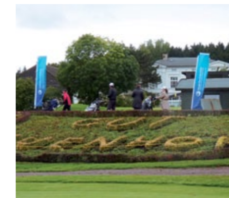
Austragungsort des Finales: Golf-Club Gut Neuenhof in Fröndenberg.