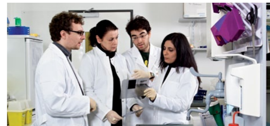
Fortschritte in der Krebsmedizin sind nur möglich, wenn Wissenschaftler regelmäßig die Ergebnisse ihrer Forschungsarbeiten austauschen und kritisch diskutieren.

Insbesondere die Nachwuchsförderung ist ein wichtiges Anliegen der Deutschen Krebshilfe. Im Rahmen ihres 'Career Development Programs' bietet sie jungen Ärzten und Naturwissenschaftlern daher Stipendien an, fördert den Aufbau von Nachwuchs-Forscherguppen und stiftet Professuren. Die Unterstützung junger Wissenschaftler trägt mit dazu bei, die Qualität der Versorgung krebserkrankter Menschen in Deutschland auf einem hohen Niveau zu halten und weiter zu verbessern.