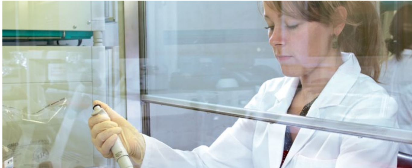
Die zahlreichen Inhaltsstoffe aus Bienenharz müssen im Labor getrennt und analysiert werden.