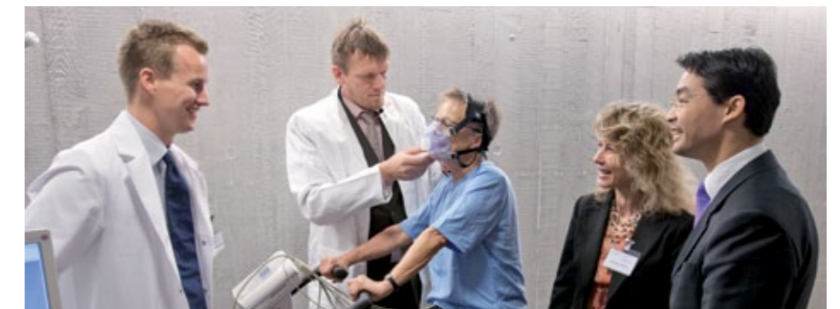
Bundesgesundheitsminister Dr. Philipp Rösler sprach mit Ärzten des NCT über ihre Arbeit.

halten zusätzlich zur Behandlung ein umfassendes Informationsangebot, beispielsweise im Rahmen der genetischen Beratung, der Ernährungsberatung, einer Rauchersprechstunde, der psychosozialen Krebsnachsorge und der Kliniksozialdienste. Auch der Krebsinformationsdienst des DKFZ ist mit einer Sprechstunde vertreten. Das NCT ist vernetzt mit den Krankenhäusern und den niedergelassenen Ärzten in der Region.