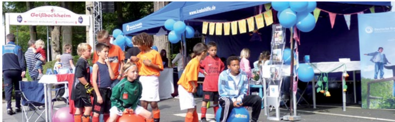
Hüpfball-Wettbewerb am Stand der Deutschen Krebshilfe.