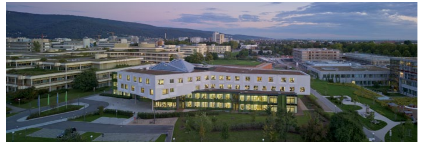
Das Nationale Centrum für Tumorerkrankungen (NCT) ist mit den Krankenhäusern und niedergelassenen Ärzten der Region vernetzt.

Heidelberg (ek) – Am 2. November 2010 wurde das Nationale Centrum für Tumorerkrankungen (NCT) im Beisein von Bundesgesundheitsminister Dr. Philipp Rösler feierlich eröffnet und an die Nutzer – das Universitätsklinikum Heidelberg, die Thoraxklinik Heidelberg und das Deutsche Krebsforschungszentrum (DKFZ) – übergeben. Die Deutsche Krebshilfe ist Bauherrin des Gebäudes.