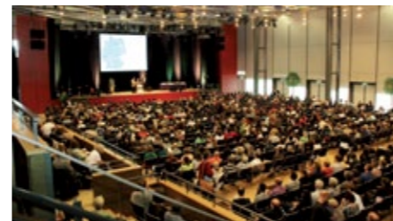
2.000 Menschen diskutierten beim Kongress über die Möglichkeiten der Palliativmedizin.

bislang über 60 Millionen Euro in den Auf- und Ausbau der Palliativmedizin investiert. Zudem hat sie den Kongress in Dresden sowohl finanziell als auch organisatorisch unterstützt.